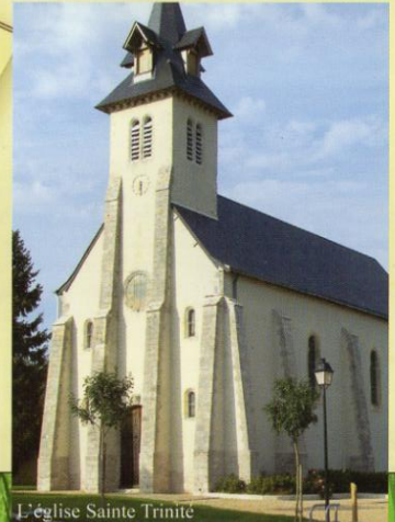
L'église Sainte Trinite